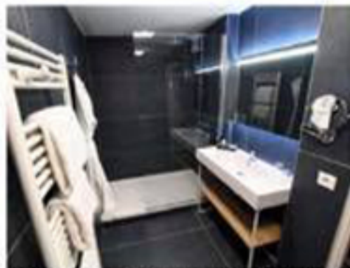
Les salles de bain ont été rénovées, avec notamment des douches plus grandes.