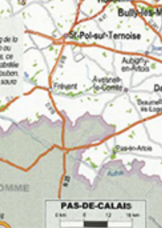
PAS-DE-CALAIS 0 5 10 15 km