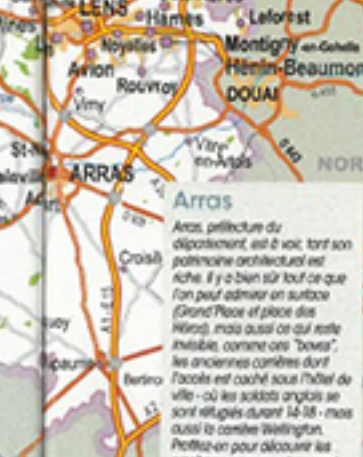
ARRAS Aras, préfecture du département, est à voir, tout son patrimoine architectural est riche. Il y a bien sûr tout ce que l'on peut admirer au surface (Grand Place et place des Herbes), mais aussi ce qui est resté invisible, comme ont "bours" les anciennes carrières dont l'accès est caché sous l'hôtel de ville - où les soldats anglais se sont réfugiés durant 14-18 - mais aussi la cathédrale Wittington. Partez-en pour découvrir les proches environs, notamment Vimy où l'incroyable nécropole de Notre-Dame-de-Lorette.